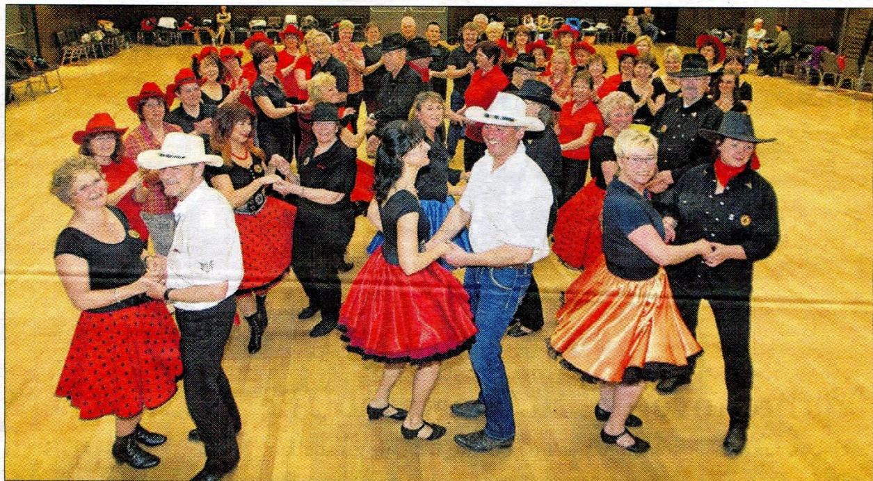
Schwungvolle Trainingsrunde im Bürgerhaussaal: Die gute Laune stellt sich bei den fast 60 Vereinsmitgliedern von selbst ein, wenn sie sich treffen. Aber auch den aktuellen Anfängerkurs besuchen über 50 Tanzlustige.